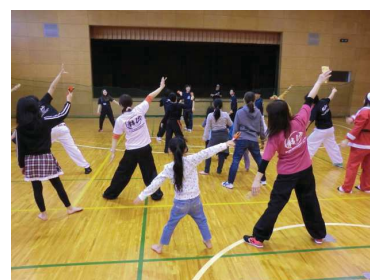
キッズクラブ活動の様子（取材当日）