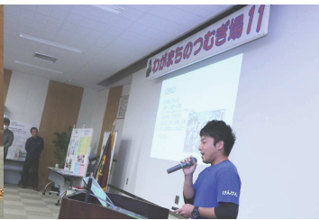
1分間スピーチ(新規出展団体)