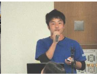
コラボ事例発表(小垣江青年団)