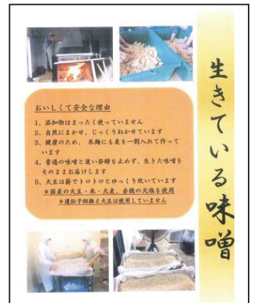
味噌の販売をしています

またお願いとして、味噌や自主製品を販売させていただける場所がありましたら、ぜひお声がけください。定期的に事業所を使用したフリーマーケットを開催していますが、様々な方のご協力が必要です。当日の運営スタッフや出店者を募集しています。また活動発表の場としてもお使いいただけます。ご興味ある方は担当までご連絡ください。