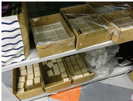
自主製品の廃油せっけん